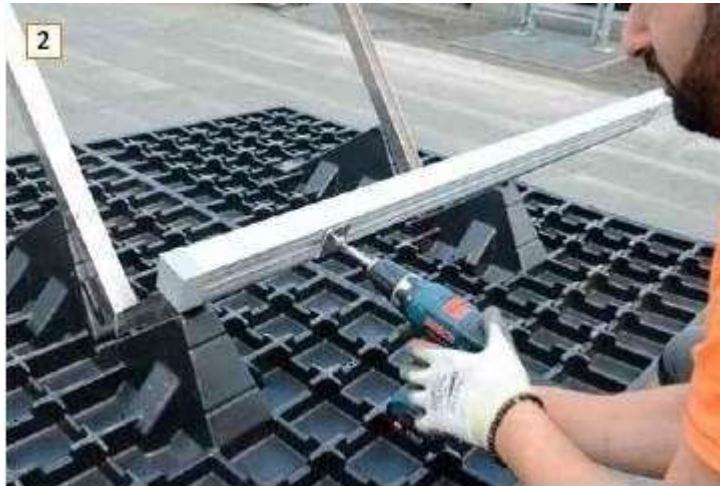
Verlegung SOLAR UK GD